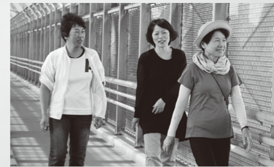
瀬戸内海の絶景と気持ちよい風に、会話も弾む楽しいウォーキング