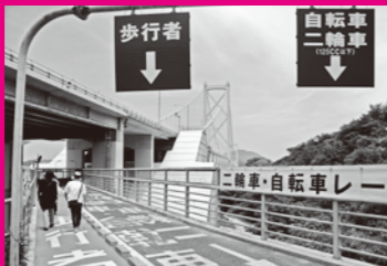
因島大橋の歩行者・自転車専用道の入り口