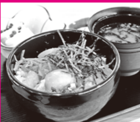
「鯛のゴマだれ丼」を昼食にして腹ごしらえ