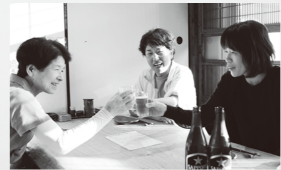
名物料理が楽しめる尾道の「たまがんぞう」で夕食。出会いの旅に乾杯!