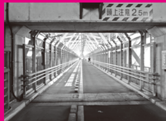
ここを海上散歩！幅員4m、全長1270m