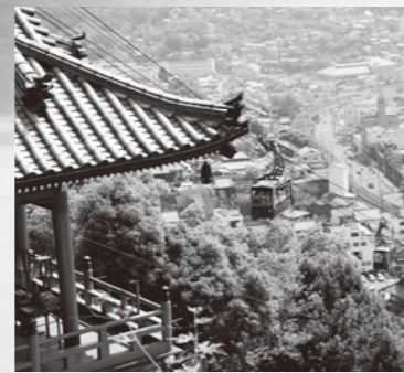
ロープウェイで登った千光寺から尾道の美しい街並みを一望

1983年の完成当時、日本一長い吊橋として話題になりました。現在は国内で8番目の大きさです。国内の吊橋で初めて鋼床板を採用するなど、この橋をかけるために培われた技術が、のちに瀬戸大橋や明石海峡大橋などに活かされました。