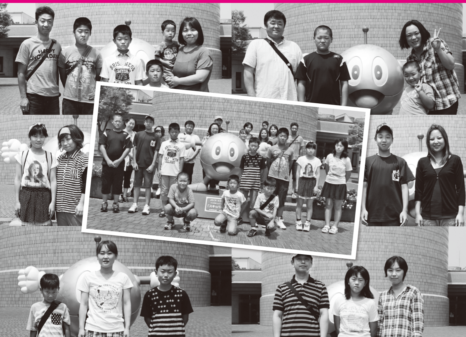
今回参加して下さった安来市立母里小学校の児童、保護者の皆様。

夏休みに入った8月3日、見学ツアー参加者の皆様は貸切バスで大阪へ。関西で有名な見学施設「ガス科学館」は、子どもたちはもとより大人も楽しめる展示や科学実験が充実しており、みんなでガスについて楽しく学ぶことができました。とくに今回は、ご家族での参加が多く、夏休みの思い出づくりとともに親子の絆を深める良い機会になったようです。 夏休み特別企画 大阪ガス「ガス科学館」 子どもも大人も楽しく学ぶ 広島ガスエナジーでは、子どもたちにエネルギーの大切さを楽しく学んでもらうため、地元小学校の学習支援を続けています。毎年、夏休みに行っているのが大阪ガス東北製造所にある「ガス科学館」の見学ツアー。12年目となる今年は、安来市立母里小学校の子どもたちと兄弟姉妹、保護者の方など21名様をご招待しました。 安来市伯太町の母里地区は、江戸時代に母里藩二万石として発展し、今も古い町並みに歴史の面影を残しています。地区の中央に位置する母里小学校では学校内外の体験活動を通じて、人や社会とより深く関わる力を高め、子どもたちの豊かな人間性をしっかりと育てています。