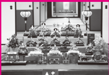
ちょうど時季が良く見られた江戸時代の雛人形