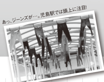
あっ、ジーンズが…。児島駅では頭上に注目!