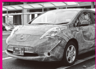
日本で1台だけのジーンズ柄タクシーに遭遇!

橋の織りなす絶景をめぐる旅に出ませんか？ 橋めぐりの旅 美しい夕景を楽しむ、 瀬戸大橋の迫力を間近で満喫