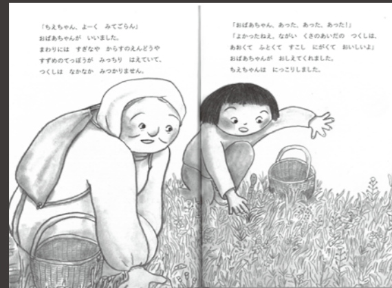
「ちえちゃん、よくみてごらん」おばあちゃんがいました。まわりにはすぎなやからすのえんどうやすすめのとっぼうがみっちりはえていて、つくしはなかなかみつきりません。