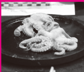
昼食は瀬戸内の味タコを鉄板で焼く「踊り食い」