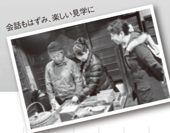
会話はずみ、楽しい見学に

瀬戸内海と本州を10の橋で結ぶ橋の総称です。全長1,2300m、幅35m。電車も走れる橋としては世界最長を誇っています。10年の歳月をかけて1988年に全通しました。総事業費は1兆円以上。春(4月)、秋(10月)には橋台内を見学できる「瀬戸大橋スカイツアー」も開催されています。