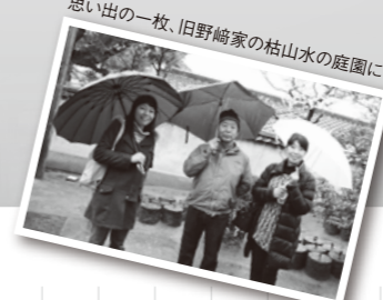
思い出の一枚、旧野崎家の枯山水の庭園にて