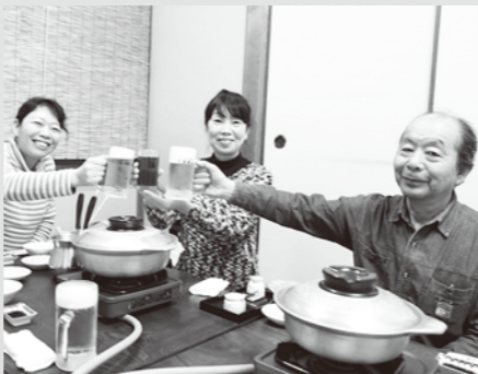
みんなで楽しく乾杯！児島の町や野崎家の話題から世間話まで、お酒が進むほどに会話が盛り上がり、天気も晴れた気分