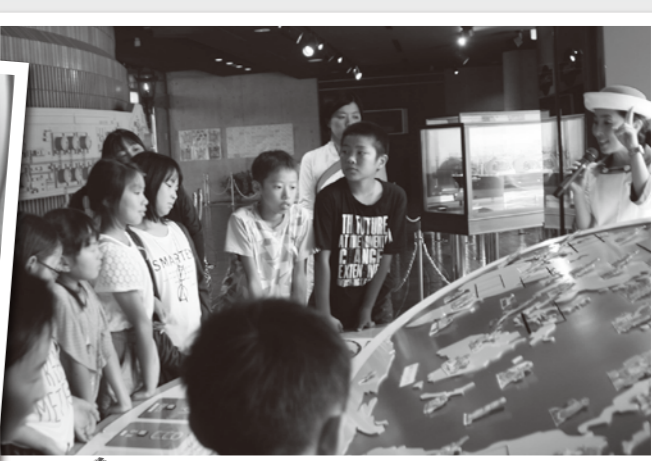
地球の化石燃料の中には残り少ないものもあって省エネやエコロジーの大切さを学んだよ