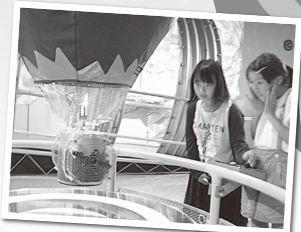
サイエンスプラザでは炎の性質などを学ぶことができたよ