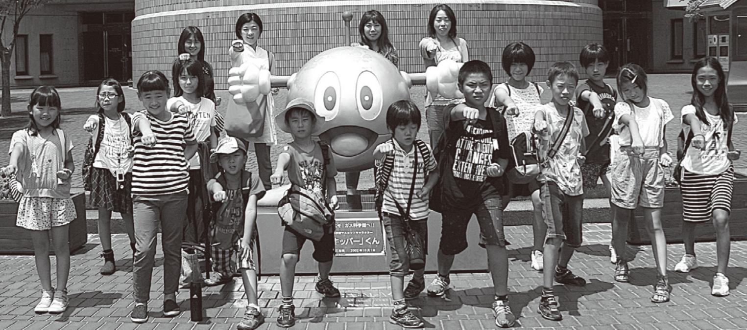
安来市空手道スポーツ少年団「福栄会安来教室」の児童、保護者の皆様