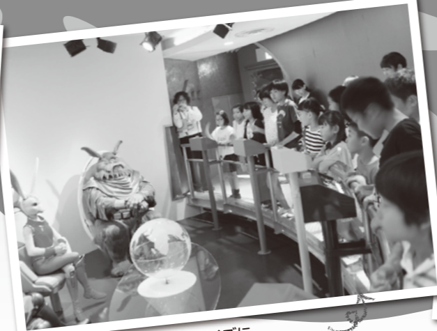
宇宙人から出題される環境クイズにチームを組んで挑戦した「スタジオスペースQ」