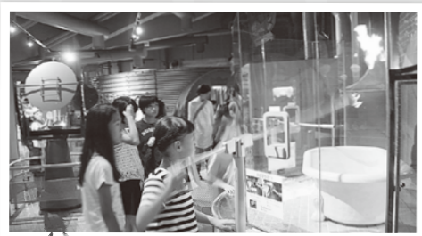
炎を使って泡を消すゲームにチャレンジ!

最後に、どのロボットが一番活躍したか参加者の拍手で決定。皆様が笑顔で拍手をおくり、とても小さくながらも能力を発揮したミクラーがコンテストに優勝しました。楽しく館内を見学した後、広さ約73万㎡という広大な工場内もバスで一周でき、地球環境やエネルギーについて好奇心の広がる夏休みとなりました。