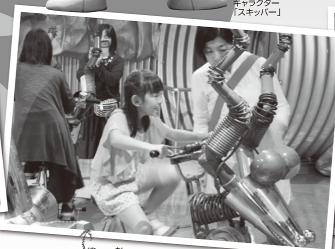
熱エネルギーをつくる人力ヒートポンプでは親子で力を合わせて自転車をこいだよ