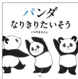
パンダなりきりたいそう いりやま さとし 講談社

この「絵本のせかい」では、世界中の心あたたまるお話をご紹介します。絵本は、お子さんの心を育む純粋な「栄養」であり、同時に親子のコミュニケーションツールでもあるのです。「絵本」を通して、親子で新しい発見をしてみてください。