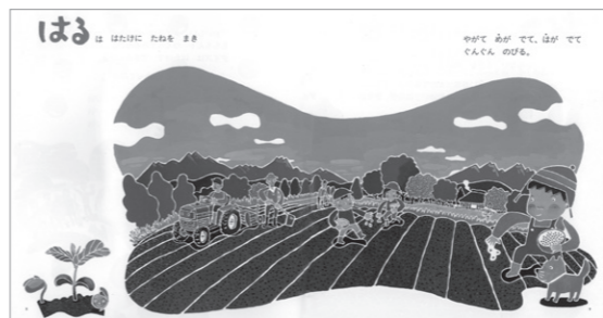
はるは はたけに たねを まき やがて めが でて、はが でて くんくん のびる。