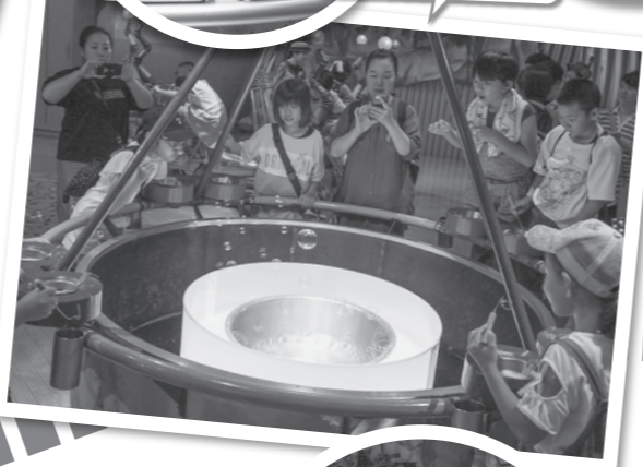
13:50 マジカル劇場で大笑い