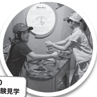
14:00 遊具学習&実験見学