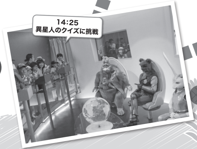
14:25 異星人のクイズに挑戦