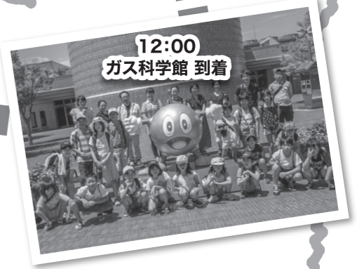
12:00 ガス科学館 到着