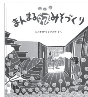
まんまるダイズみそづくり ミノオカ・リョウスケ / 福音館書店刊

この「絵本のせかい」では、世界中の心あたたまるお話をご紹介します。絵本は、お子さんの心を育む純粋な「栄養」であり、同時に親子のコミュニケーションツールでもあります。「絵本」を通して、親子で新しい発見をしてみてください。