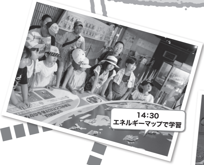
14:30 エネルギーマップで学習