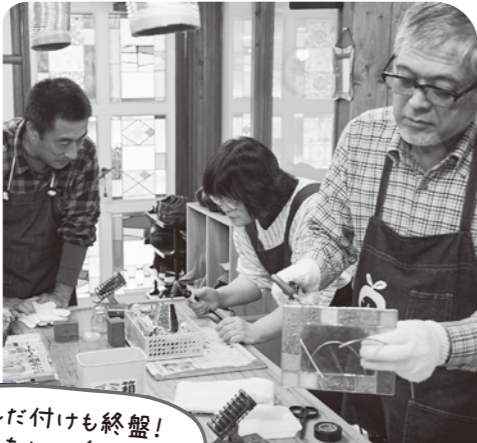
はんだ付けも終盤! あと一息。