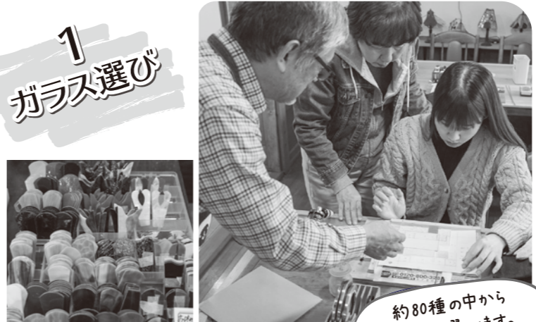
約80種の中から ガラスを選びます。