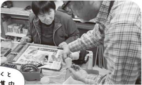
もくもくと 作業に集中