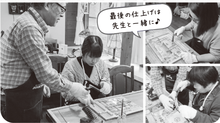
最後の仕上げは 先生と一緒に♪