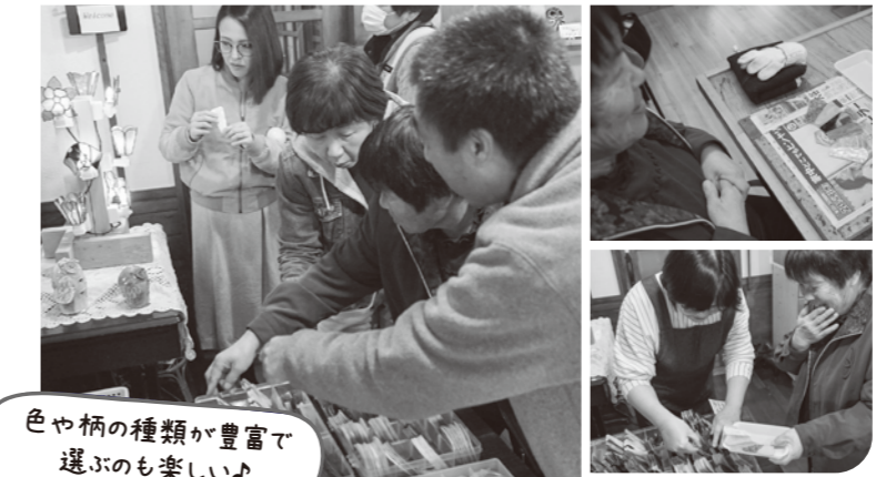
色や柄の種類が豊富で 選ぶのも楽しい♪