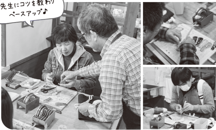
先生にコツを教わり ペースアップ♪