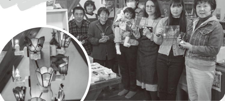
完成品を持って記念撮影! 良い思い出になりました♪